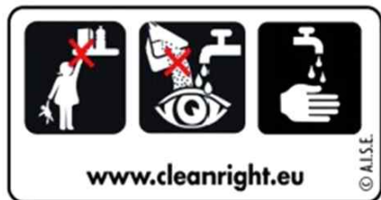
<그림> 그림기호 표시 예시